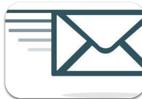
Mails de retro- information