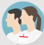
Module Soins médicaux

La formation à distance sur l'hygiène des mains se décline en trois modules.