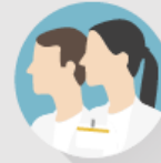
Module Soins de base

Les situations de soins proposées dans les exercices pratiques sont ciblées en fonction de la catégorie professionnelle pour favoriser le transfert des connaissances dans la pratique professionnelle quotidienne.